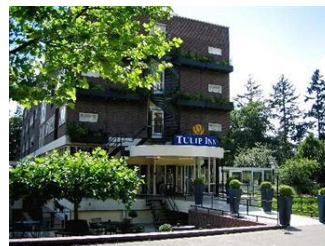
Hotel Tulip Inn de Veluwe: