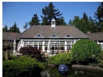
Hotel Golden Tulip Victoria:

Wilt u op internet zoeken in welk hotel u mogelijk verblijft tijdens de spelen? U kunt ze vinden op de volgende websites: